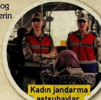
Kadın jandarma astsubaylar, öğrencilerle sürekli diyalog halinde.

astsubaylar, sürekli diyalog halinde oldukları öğrencilerin sorun ve taleplerini de dinliyor. Öğrenciler, "Onlar sayesinde kendimizi daha güvende hissediyoruz. Bize çok dostça yaklaşıyorlar" diyor. Muhammed Sami MARAL (DHA)